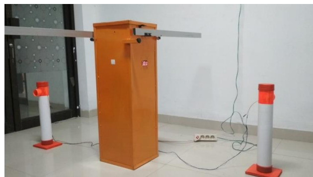
Gambar 3.1 Hasil Rancangan Keseluruhan

Perancangan merupakan suatu proses permulaan sebelum melakukan suatu pekerjaan. Setelah pembuatan perancangan alat, maka langkah selanjutnya adalah pengujian alat dan analisa data dari alat yang telah dibuat. Tujuan pengujian alat ini adalah untuk mengetahui apakah alat real yang menggunakan Sensor fingerprint, Arduni Mega, Drive Motor, Motor Gearbox, sensor PIR dan Limit Switch bekerja sesuai perancangan alat. Adapun pengujian yang dilakukan yaitu pengujian terhadap hardware maupun pengujian software serta analisa pembahasan terhadap data yang diperoleh.