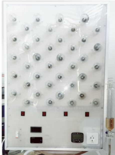
Gambar 4. Panel Observasi Digital

Panel Observasi Digital yang dikembangkan tampak pada Gambar 4. Masih tersedia tempat pada area monitor luaran alat ukur yang dapat digunakan untuk alat ukur lain dalam pengembangan praktikum atau penelitian.