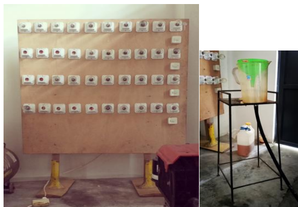
Gambar 2. Panel Existing Laboratorium Terpadu ITK

Irawansyah dkk, (2019) dan Irbabunnuha dkk, (2020) membuat dinamometer tipe Prony Break untuk laboratorium karena mahalnya harga sebuah dinamometer. Namun dalam pengukuran, mereka masih menggunakan metode analog atau secara manual. Dinamometer industri memberikan sejumlah besar parameter luaran, yang mungkin sebenarnya tidak diperlukan dalam suatu percobaan, di mana pengulangan dilakukan. Pengujian berulang pada dinamometer industri terbukti cukup mahal. Dengan demikian, metode sangkil dan hemat biaya untuk pengujian dikembangkan sebagai solusi (Nalawade dkk, 2020).