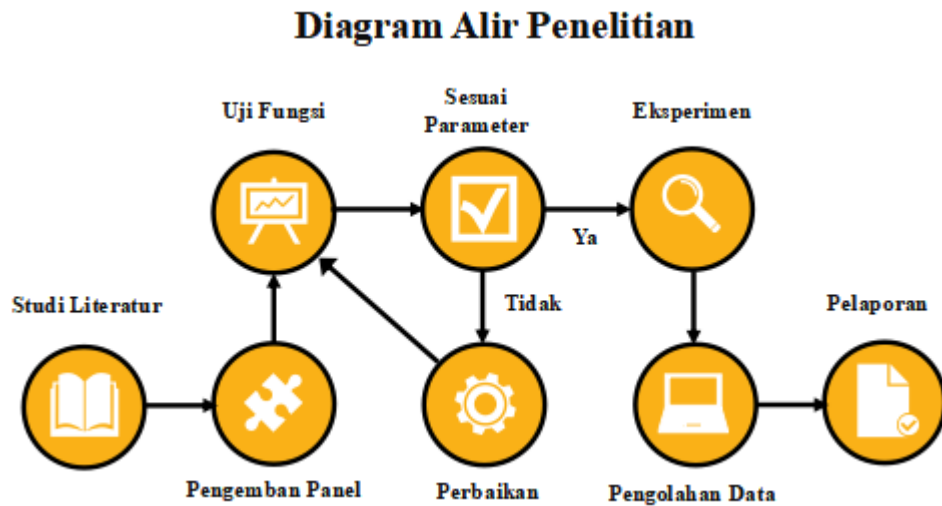
Gambar 3. Diagram Alir Penelitian

Adapun langkah-langkah penelitian ini diilustrasikan pada diagram alir berikut: