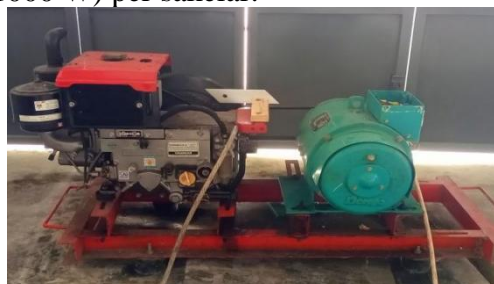
Gambar 1. Mesin Genset Laboratorium Terpadu ITK

Pengujian motor bakar genset yang ada di Laboratorium Terpadu Institut Teknologi Kalimantan (ITK) menggunakan mesin diesel pabrikan Yanmar TF85MLYS dan dinamo Denyo FA-5 yang dirangkai dalam satu sasis. Asupan bahan bakar menggunakan gelas ukur plastik yang dimodifikasi dengan slang sebagai penghubung ke mesin. Lampu 100 Watt sejumlah 40 buah (4000 W) sebagai beban dirangkai seri pada sebidang tripleks (panel existing ) dengan pembagian 10 lampu (1000 W) per sakelar.