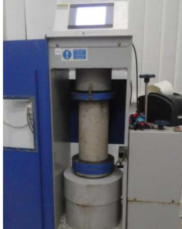
Gambar 1. Pengujian Kekuatan Tekan