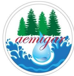
Gambar 2 Logo Aemigar

Desain kemasan air mineral yang bagus dan menarik sangat menarik dan kreatif, dirancang dengan usaha semaksimal mungkin.