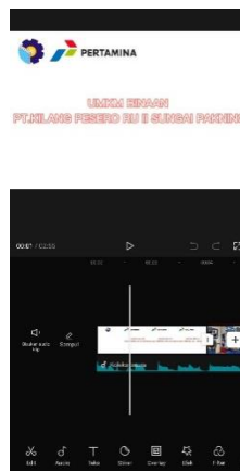
Gambar 3 Editing with Application Capcut

Setelah pengambilan video selesai dari tahap evaluasi langsung dieksekusi untuk diedit menggunakan beberapa aplikasi edit video seperti Capcut, setelah itu videonya kita render setelah selesai kemudian kita serahkan ke UMKM terkait untuk di posting di media market mereka.